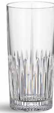
P634000C NEW VASO ALTO HIGH GLASS Ø7x15cm (33cl) | 6u.