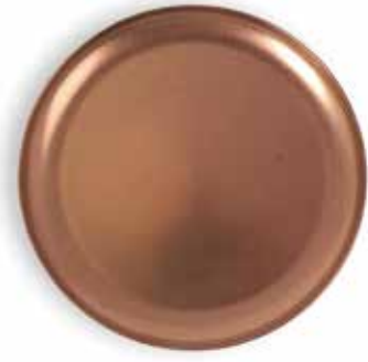
P266002B NEW PLATO LLANO FLAT PLATE Ø23x1,7cm | 12u.