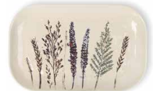
P1505024 NEW BANDEJA RECTANGULAR RECTANGULAR TRAY 24,5x15x2,5cm | 4u.