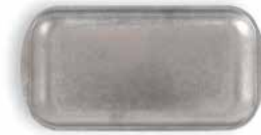
P1501001A NEW BANDEJA TRAY 33,5x17x1,5cm | 12u.