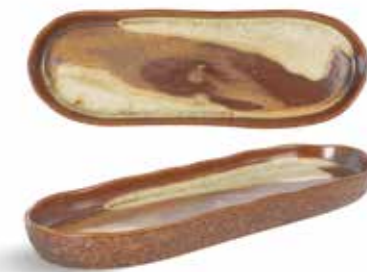
P1505013 NEW BANDEJA OVAL OVAL TRAY 26x8,5x2,5cm | 4u.