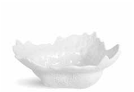
P997090 NEW BOWL BOWL 23x18x7,5cm | 6u.