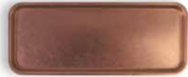
P1501004B NEW BANDEJA TRAY 32x13x1,2cm | 12u.