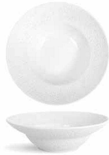
P997083 NEW PLATO PASTA PASTA PLATE 24x7cm | 6u.