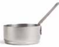
P266025 BOWL DEGUSTACIÓN TASTING BOWL Ø7,2x3,5cm (10cl) | 12u.