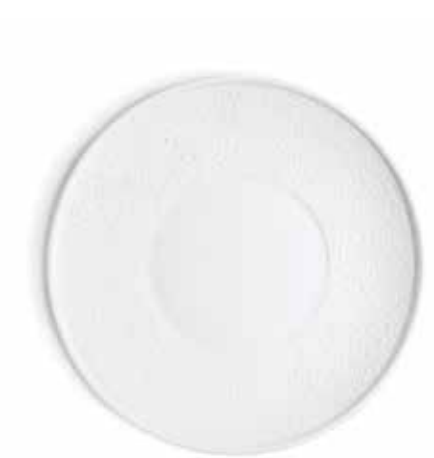
P965019 PLATO REDONDO GOURMET GOURMET ROUND PLATE Ø28x3,5cm | 6u.