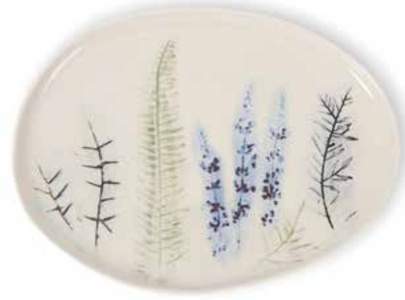
P1505021 NEW BANDEJA OVAL OVAL TRAY 34,5x26x2cm | 2u.