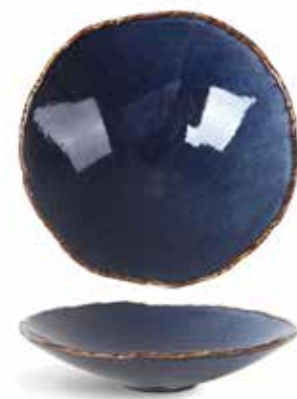
P1503006 NEW PLATO HONDO DEEP PLATE Ø24x6cm | 6u.