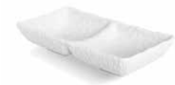
P997096 NEW BOWL DOBLE DOUBLE BOWL 17,5x8,5x3,5cm | 12u.