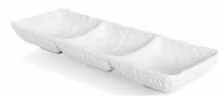
P997095 NEW BOWL TRIPLE TRIPLE BOWL 26x8,5x3,5cm | 6u.