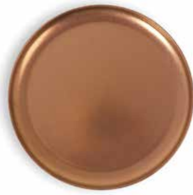
P266000B NEW PLATO PRESENTACIÓN PRESENTATION PLATE Ø30x2cm | 12u.