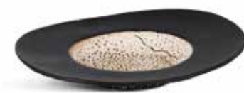
P997026 PLATO OVAL OVAL PLATE 30,5x26x4,5cm | 2u.