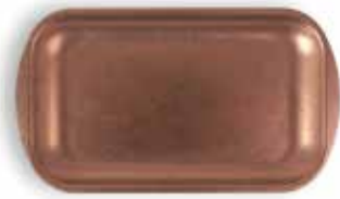
P1501002B NEW BANDEJA TRAY 27,5x15,5x1,5cm | 12u.