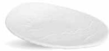
P997093 NEW BANDEJA TRAY 20x16x4,5cm | 12u.