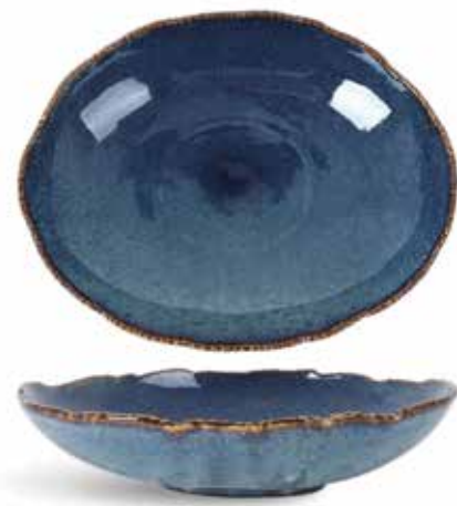
P1503008 NEW ENSALADERA SALAD BOWL 31x24x7cm | 4u.