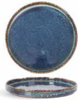
P1503004 NEW PLATO PLATE Ø21x2,5cm | 6u.