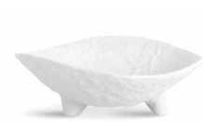
P997085 NEW BOWL BOWL 23,5x8cm | 6u.