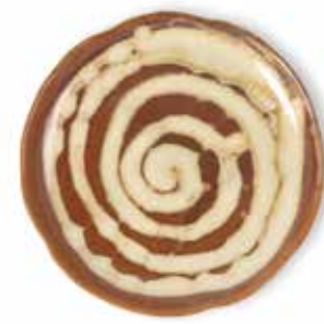
P1505003 NEW PLATO PAN BREAD PLATE Ø16x1,5cm | 6u.