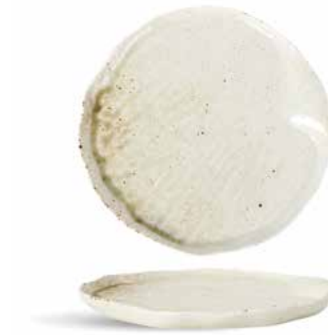
P1503025 NEW BANDEJA OVAL OVAL TRAY Ø30,2x2cm | 6u.