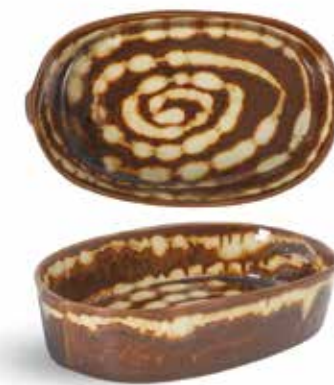
P1505008 NEW FUENTE OVAL OVAL TRAY 22x13,5x4,5cm | 4u.