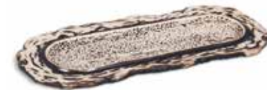
P997010 BANDEJA RECTANGULAR RECTANGULAR TRAY 35x15x2cm | 4u.