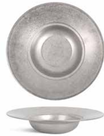
P1501018A NEW PLATO PASTA PASTA PLATE Ø26x5,6cm | 12u.