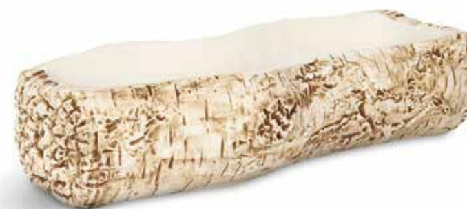
P997109 NEW FUENTE TRAY 32x13x8cm | 3u.