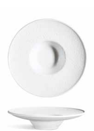
P965021 PLATO REDONDO RISOTTO RISOTTO ROUND PLATE Ø24x5,5cm | 6u.