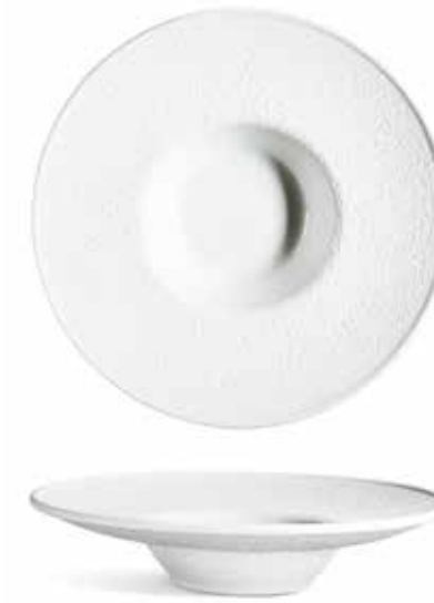
P965020 PLATO REDONDO RISOTTO RISOTTO ROUND PLATE Ø28x6cm | 6u.