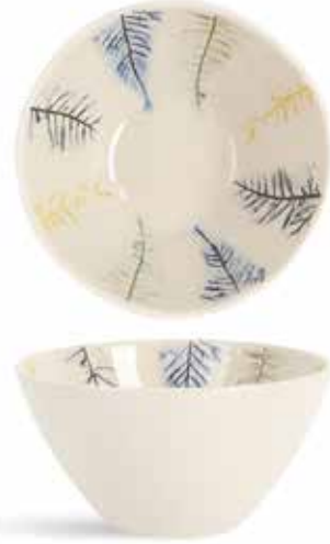
P1505019 NEW BOWL BOWL Ø16,5x8cm (83cl) | 4u.