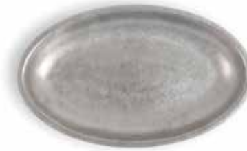
P1501006A NEW BANDEJA OVAL OVAL TRAY 30x18,5x2,5cm | 12u.