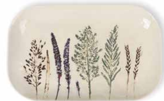
P1505023 NEW BANDEJA RECTANGULAR RECTANGULAR TRAY 31,5x19,5x3cm | 4u.