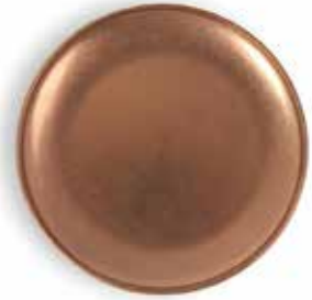
P266004B NEW PLATO POSTRE DESSERT PLATE Ø17x1,5cm | 12u.