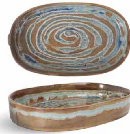
P1505007 NEW FUENTE OVAL OVAL TRAY 31x18x4,5cm | 4u.