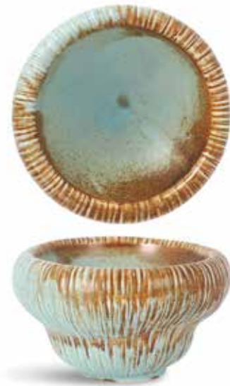
P1503020 NEW BOWL BOWL Ø12x7cm (52cl) | 6u.