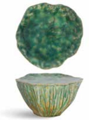
P1505028 NEW PLATAFORMA PLATFORM Ø13x7cm | 6u.