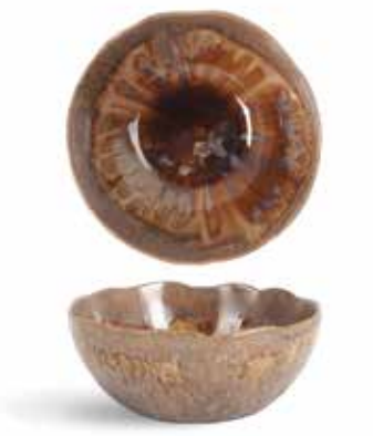
P1505005 NEW BOWL BOWL Ø15x6,5cm (68cl) | 6u.