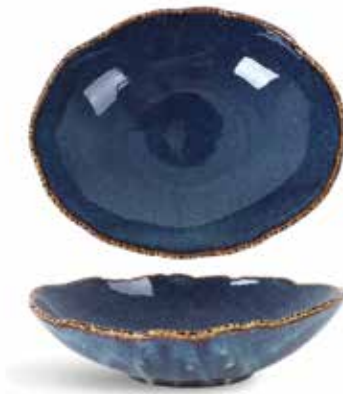
P1503009 NEW ENSALADERA SALAD BOWL 25x20x7cm | 4u.