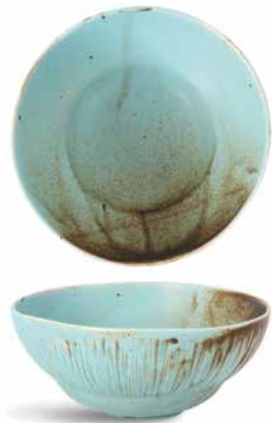
P1503021 NEW BOWL BOWL Ø15x6cm (50cl) | 6u.