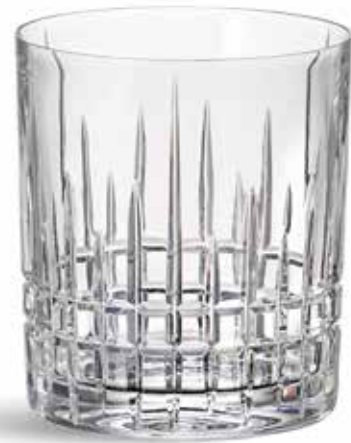
P634001B NEW VASO BAJO LOW GLASS Ø8,5x10cm (30cl) | 6u.