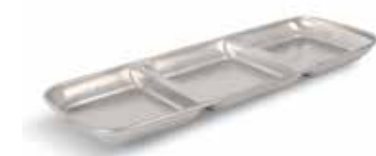
P1501007A NEW BANDEJA 3 COMP. TRAY 3 COMP. 22,5x9x1,5cm | 24u.