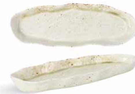
P1503033 NEW BANDEJA RECTANGULAR RECTANGULAR TRAY 32,5x11,5x2,5cm | 6u.