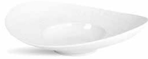
P997082 NEW PLATO RISOTTO RISOTTO PLATE 27x22,5x6cm | 6u.