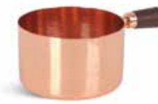
P263V000C NEW SALSERA SAUCEBOAT 8x5cm (25cl) | 12u.