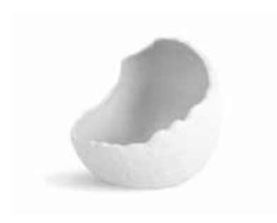
P997100 NEW BOWL DEGUSTACIÓN TASTING BOWL Ø15x14cm | 6u.