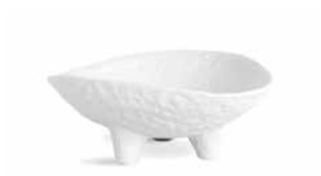
P997086 NEW BOWL BOWL 18,5x8cm | 6u.