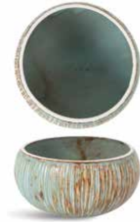
P1503023 NEW BOWL BOWL Ø10x6cm (22cl) | 12u.