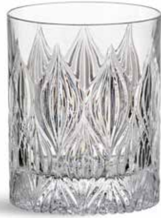
P634001A NEW VASO BAJO LOW GLASS Ø8,5x10cm (30cl) | 6u.