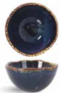
P1503014 NEW BOWL BOWL Ø7,5x4cm (6c1) | 12u.