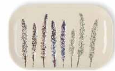
P1505025 NEW BANDEJA RECTANGULAR RECTANGULAR TRAY 18,5x11,5x2cm | 6u.