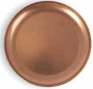
P266003B NEW PLATO POSTRE DESSERT PLATE Ø20x1,5cm | 12u.