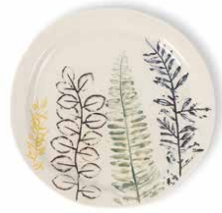
P1505016 NEW PLATO POSTRE DESSERT PLATE Ø21x2cm | 4u.