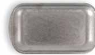
P1501002A NEW BANDEJA TRAY 27,5x15,5x1,5cm | 12u.