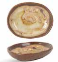
P1505014 NEW SALSERA SAUCEBOAT 10x8x2cm | 12u.