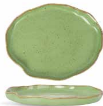
P1503026 NEW BANDEJA OVAL OVAL TRAY 22,5x18x1,5cm | 6u.