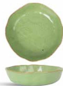
P1503028 NEW ENSALADERA SALAD BOWL Ø20x4,5cm | 3u.