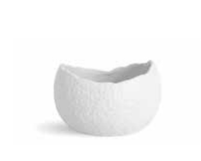
P997099 NEW BOWL OVAL OVAL BOWL 14x13x9cm (70cl) | 6u.