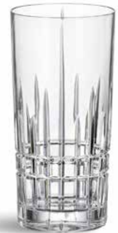
P634000B NEW VASO ALTO HIGH GLASS Ø7x15cm (33cl) | 6u.