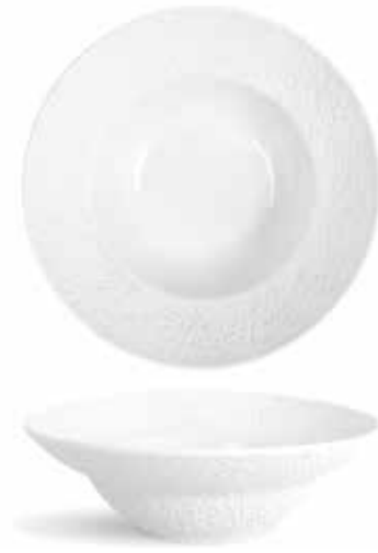
P997084 NEW PLATO PASTA PASTA PLATE 20x6cm | 6u.