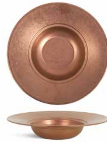
P1501018B NEW PLATO PASTA PASTA PLATE Ø26x5,6cm | 12u.