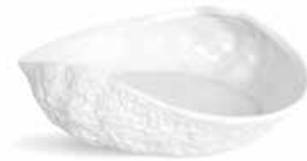
P997088 NEW ENSALADERA SALAD BOWL 20x16,5x5,5cm | 6u.