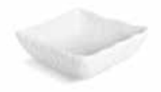
P997097 NEW BOWL BOWL 9x9x3,5cm | 12u.