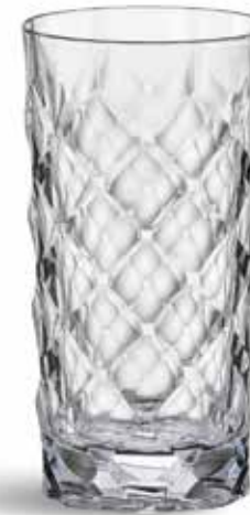
P634000D NEW VASO ALTO HIGH GLASS Ø7x15cm (33cl) | 6u.