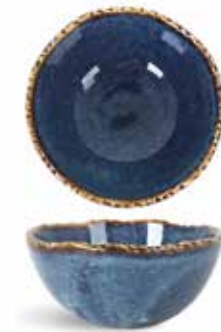
P1503013 NEW BOWL BOWL Ø11,5x5,5cm (22c1) | 12u.