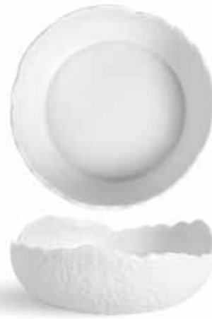
P997098 NEW ENSALADERA SALAD BOWL Ø21x7cm | 4u.