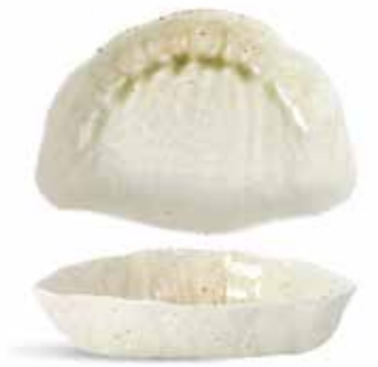
P1503029 NEW ENSALADERA SALAD BOWL 25x17,5x6cm | 3u.