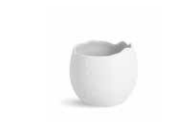
P997101 NEW BOWL BOWL Ø10,5x10cm (50cl) | 6u.