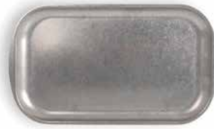
P1501000A NEW BANDEJA TRAY 41,5x23,5x1,5cm | 12u.