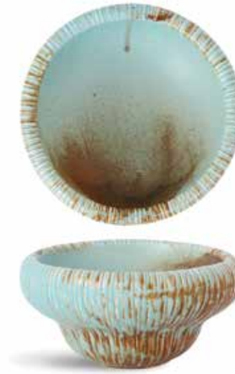
P1503019 NEW BOWL BOWL Ø15,5x7,5cm (34cl) | 6u.