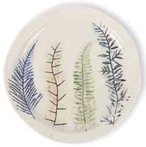
P1505015 NEW PLATO LLANO PLANE PLATE Ø27x2,5cm | 4u.