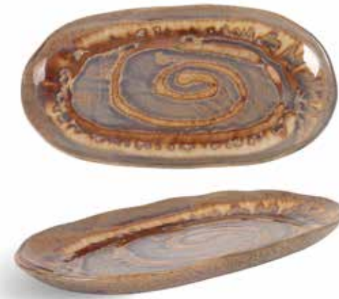
P1505012 NEW BANDEJA OVAL OVAL TRAY 34x17,5x2,5cm | 4u.