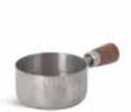
P263V003A NEW SALSERA SAUCEBOAT 5,5x2,5cm (6cl) | 12u.