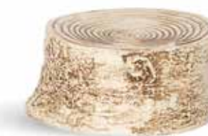
P997112 NEW PLATAFORMA PLATFORM Ø10x5cm | 9u.