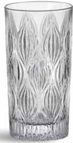
P634000A NEW VASO ALTO HIGH GLASS Ø7x15cm (33cl) | 6u.