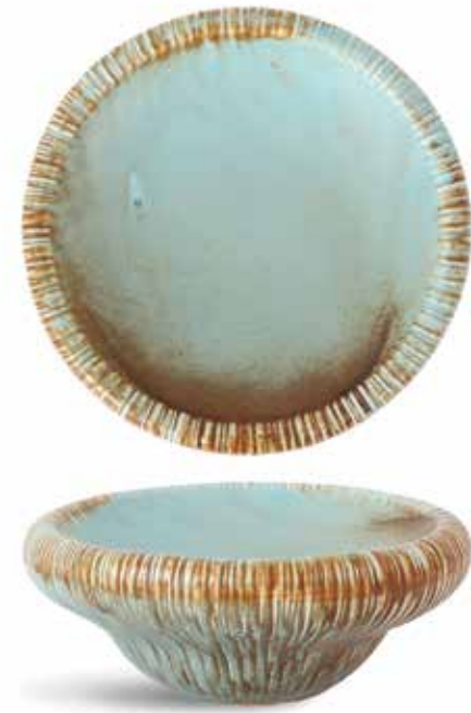
P1503018 NEW PLATO PLATE Ø18x7cm | 4u.