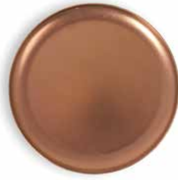
P266001B NEW PLATO LLANO FLAT PLATE Ø26x2cm | 12u.