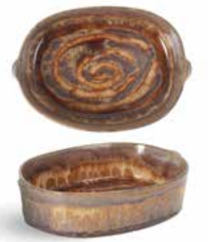
P1505009 NEW FUENTE OVAL OVAL TRAY 17x12x4,5cm | 6u.