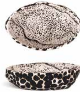
P997047 BOWL RECTANGULAR RECTANGULAR BOWL 23x15x6cm | 6u.