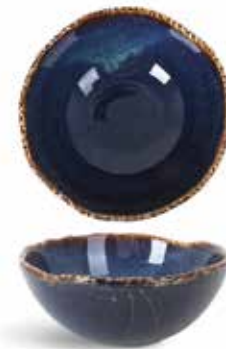
P1503012 NEW BOWL BOWL Ø15x6cm (45c1) | 6u.