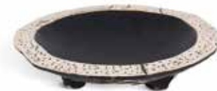
P997012 PLATO ALA OVAL PLATE Ø26x6cm | 3u.