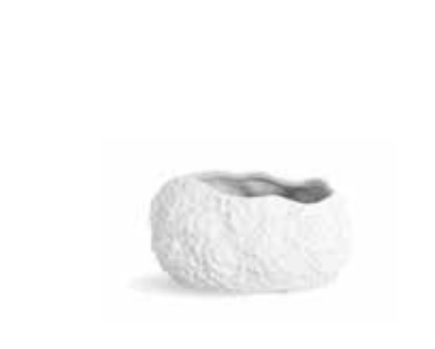
P997091 NEW BOWL BOWL 12x8,5x6cm | 6u.