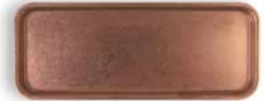
P1501005B NEW BANDEJA TRAY 30x12x1,2cm | 12u.