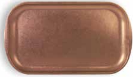
P1501000B NEW BANDEJA TRAY 41,5x23,5x1,5cm | 12u.