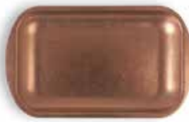
P1501003B NEW BANDEJA TRAY 23,5x14x1,5cm | 12u.