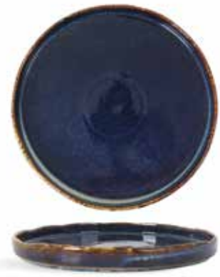
P1503003 NEW PLATO PLATE Ø25,5x2cm | 6u.