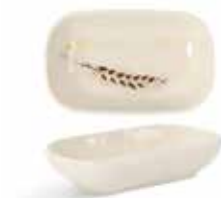
P1505026 NEW BANDEJA RECTANGULAR RECTANGULAR TRAY 10,5x6,5x2cm | 12u.