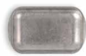
P1501003A NEW BANDEJA TRAY 23,5x14x1,5cm | 12u.