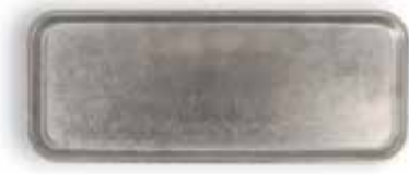
P1501005A NEW BANDEJA TRAY 30x12x1,2cm | 12u.