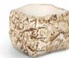
P997111 NEW BOWL CUADRADO SQUARE BOWL 8,5x8,5x6,5cm | 12u.