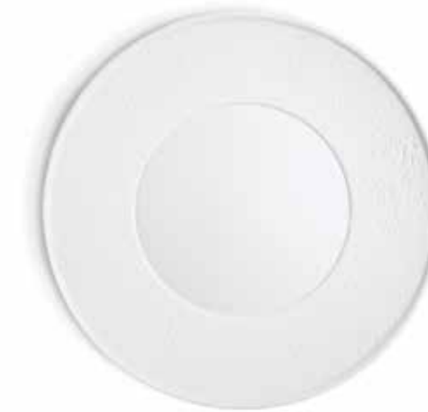
P965018 PLATO REDONDO GOURMET GOURMET ROUND PLATE Ø32x3,5cm | 6u.