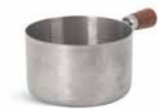
P263V000A NEW SALSERA SAUCEBOAT 8x5cm (25cl) | 12u.