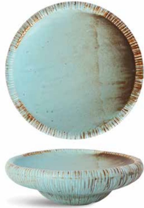
P1503017 NEW PLATO PLATE Ø23x7,5cm | 4u.