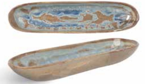
P1505011 NEW BANDEJA OVAL OVAL TRAY 31x7,5x4cm | 6u.