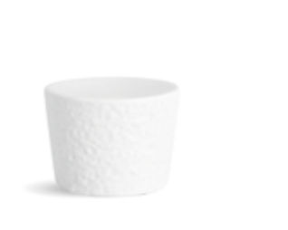
P997105 NEW PLATAFORMA PLATFORM Ø11x8cm | 6u.