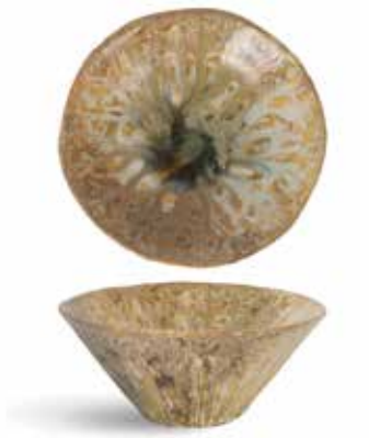
P1505029 NEW PLATAFORMA PLATFORM Ø13x6cm | 6u.