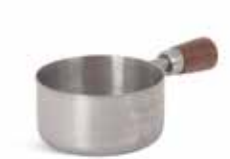
P263V002A NEW SALSERA SAUCEBOAT 6x3cm (8cl) | 12u.