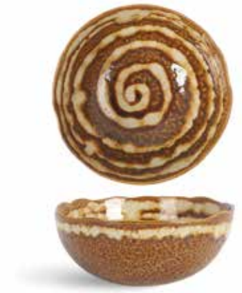
P1505004 NEW BOWL BOWL Ø18,5x7,5cm (112cl) | 4u.