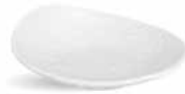
P997094 NEW BANDEJA TRAY 15x11x4cm | 12u.