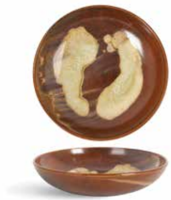
P1505002 NEW PLATO HONDO DEEP DISH Ø20x4,5cm | 6u.