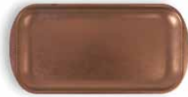
P1501001B NEW BANDEJA TRAY 33,5x17x1,5cm | 12u.