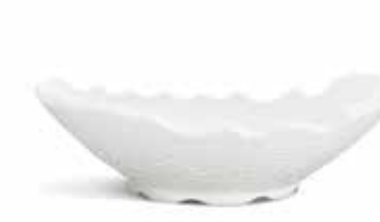
P965034 BOWL BOWL 24x21x8cm | 3u.