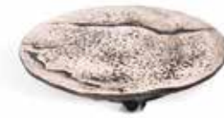
P997006 PLATO PLATE Ø20x5cm | 2u.