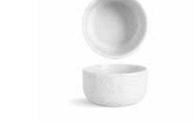
P997103 NEW BOWL BOWL Ø10x5cm (25cl) | 12u.