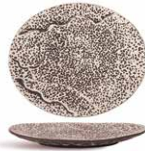
P997080 NEW BANDEJA OVAL OVAL TRAY 24x20x3cm | 6u.