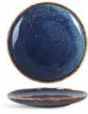
P1503002 NEW PLATO PAN BREAD PLATE Ø16x2cm | 12u.