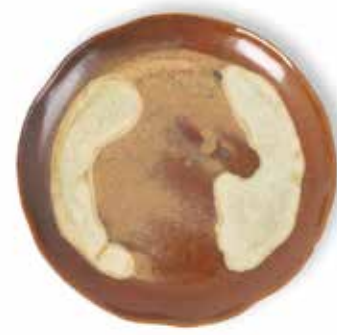
P1505001 NEW PLATO LLANO PLANE PLATE Ø22,5x2cm | 6u.