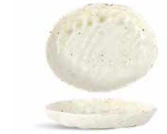
P1503032 NEW BANDEJA OVAL OVAL TRAY 18x14x2,5cm | 6u.