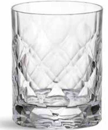
P634001D NEW VASO BAJO LOW GLASS Ø8,5x10cm (30cl) | 6u.