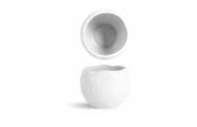
P997102 NEW BOWL BOWL Ø8x6cm (15cl) | 12u.