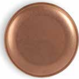
P266005B NEW PLATO PAN BREAD PLATE Ø14x1,2cm | 12u.