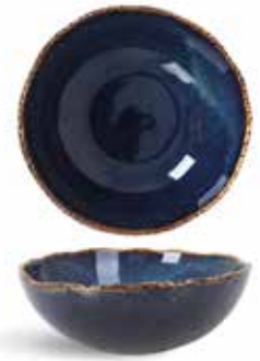
P1503011 NEW BOWL BOWL Ø20x7cm (120c1) | 6u.