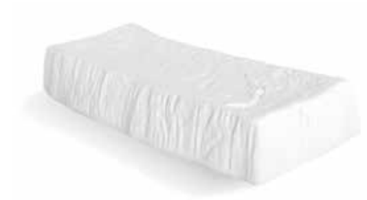
P997092 NEW BANDEJA TRAY 29,5x13,5x5cm | 6u.