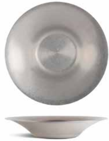
P266006 PLATO PASTA PASTA PLATE Ø27x5cm | 6u.