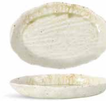
P1503031 NEW BANDEJA OVAL OVAL TRAY 27,5x18,5x3,5cm | 3u.