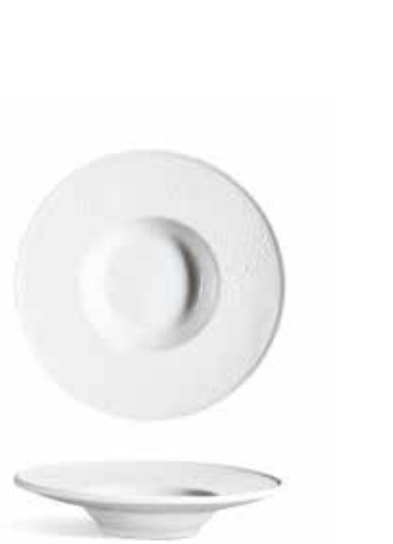
P965022 PLATO REDONDO DEGUSTACIÓN TASTING ROUND PLATE Ø20x4,5cm | 6u.