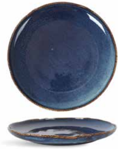
P1503000 NEW PLATO LLANO PLANE PLATE Ø27,5x3,5cm | 6u.