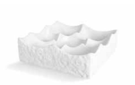
P997107 NEW PLATO 7 COMP. 7 COMP. PLATE 20x20x6cm | 4u.