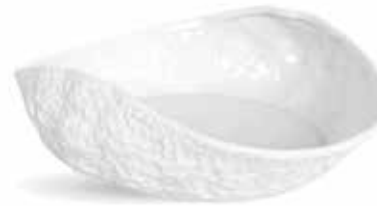
P997087 NEW ENSALADERA SALAD BOWL 26x20x7cm | 6u.