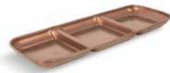
P1501007B NEW BANDEJA 3 COMP. TRAY 3 COMP. 22,5x9x1,5cm | 24u.