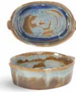
P1505010 NEW FUENTE OVAL OVAL TRAY 13x8,5x4cm | 12u.