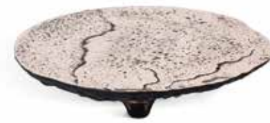
P997004 PLATO PLATE Ø32x6cm | 1u.