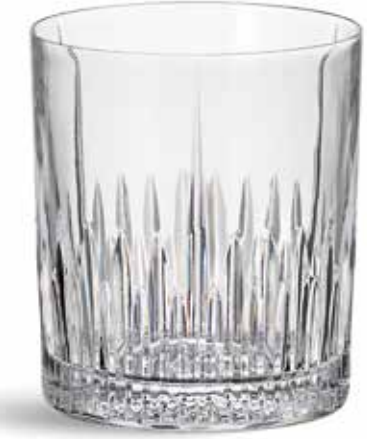
P634001C NEW VASO BAJO LOW GLASS Ø8,5x10cm (30cl) | 6u.