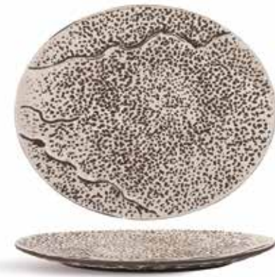
P997079 NEW BANDEJA OVAL OVAL TRAY 32x26,5x2,5cm | 6u.