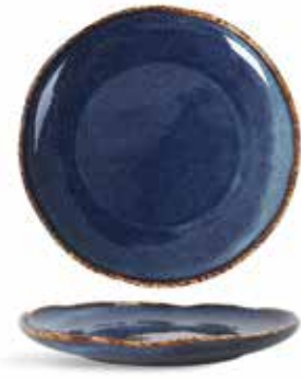
P1503001 NEW PLATO POSTRE DESSERT PLATE Ø21x3cm | 6u.