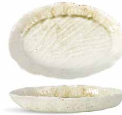
P1503030 NEW BANDEJA OVAL OVAL TRAY 33x21,5x4cm | 3u.