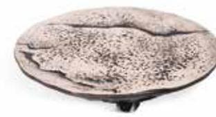
P997005 PLATO PLATE Ø26x6cm | 1u.