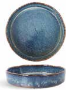
P1503005 NEW ENSALADERA SALAD BOWL Ø20,5x4,5cm | 6u.