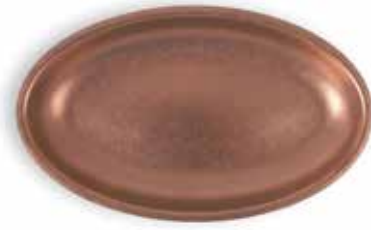
P1501006B NEW BANDEJA OVAL OVAL TRAY 30x18x2,5cm | 12u.