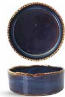
P1503015 NEW BOWL BOWL Ø13x5cm (38c1) | 6u.