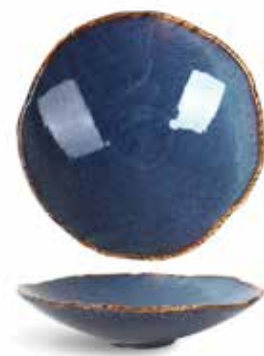
P1503007 NEW PLATO HONDO DEEP PLATE Ø21,5x5cm | 6u.