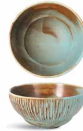
P1503022 NEW BOWL BOWL Ø11,5x5,5cm (24cl) | 6u.