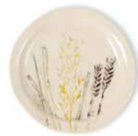
P1505017 NEW PLATO PAN BREAD PLATE Ø13x1,5cm | 12u.