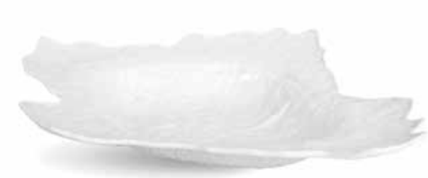
P997089 NEW BANDEJA OVAL OVAL TRAY 38x30x7cm | 6u.