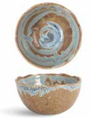
P1505006 NEW BOWL BOWL Ø12x6cm (38cl) | 12u.