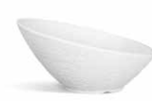
P965025 PLATO REDONDO TRATTORIA TRATTORIA ROUND PLATE Ø21x10cm | 6u.