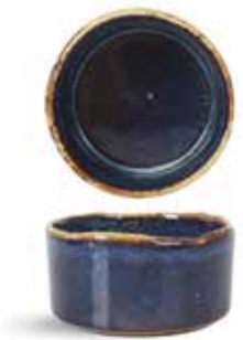
P1503016 NEW BOWL BOWL Ø11x5,5cm (28c1) | 6u.