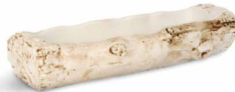
P997108 NEW FUENTE TRAY 39x11,5x8cm | 3u.

Just like the Baroque works of artists such as Gian Lorenzo Bernini or Peter Paul Rubens, who often employed natural details in a bold manner to convey power and emotion, CEDRO possesses a physical presence that challenges the conventional perception of the object. Its organic and powerful form invites us to interact with the piece as we savor what it offers.