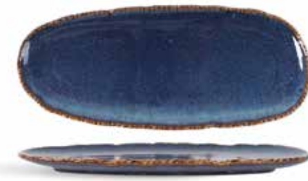
P1503010 NEW BANDEJA RECTANGULAR RECTANGULAR TRAY 34x14x2,5cm | 6u.