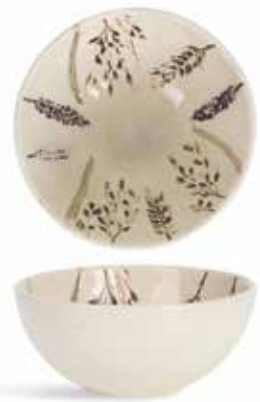
P1505020 NEW BOWL BOWL Ø11,5x5cm (24cl) | 6u.