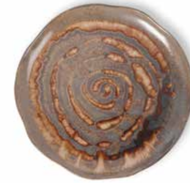
P1505000 NEW PLATO LLANO PLANE PLATE Ø27x2,5cm | 6u.