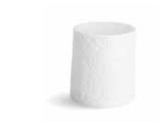
P997104 NEW PLATAFORMA PLATFORM Ø10,5x11,5cm | 6u.