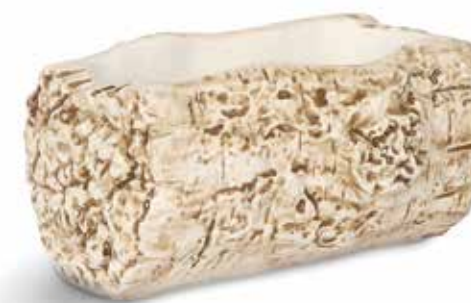
P997110 NEW BOWL RECTANGULAR RECTANGULAR BOWL 17x10x8cm | 4u.