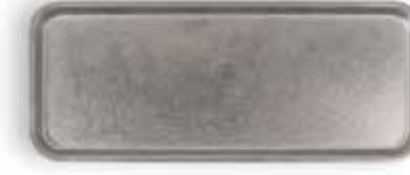
P1501004A NEW BANDEJA TRAY 32x13x1,2cm | 12u.