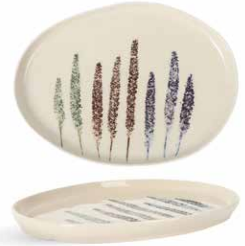
P1505022 NEW BANDEJA OVAL OVAL TRAY 25,5x19x2cm | 4u.