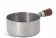
P263V001A NEW SALSERA SAUCEBOAT 7x3,5cm (12,5cl) | 12u.