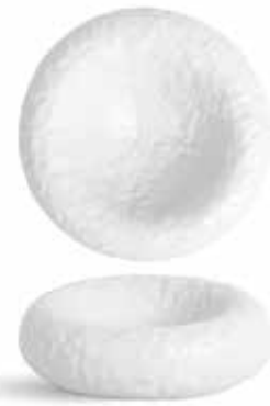
P997106 NEW PLATO DEGUSTACIÓN TASTING PLATE Ø18x7cm | 4u.