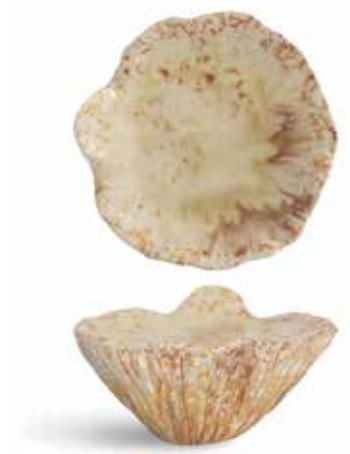
P1505027 NEW PLATAFORMA PLATFORM Ø17x8,5cm | 4u.