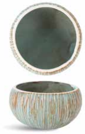
P1503024 NEW BOWL BOWL Ø7,5x5cm (10cl) | 12u.