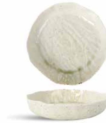
P1503027 NEW ENSALADERA SALAD BOWL Ø25x5cm | 3u.