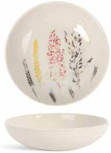
P1505018 NEW PLATO HONDO DEEP PLATE Ø20,5x4,5cm | 4u.